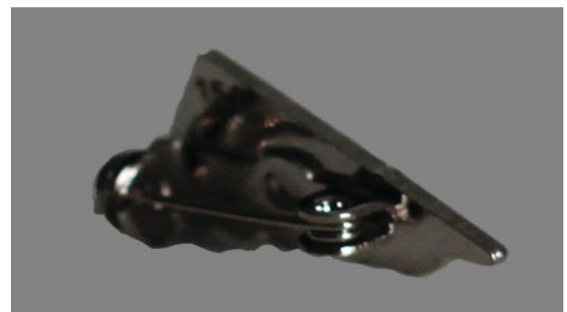
Hopeinen pinssi takaa