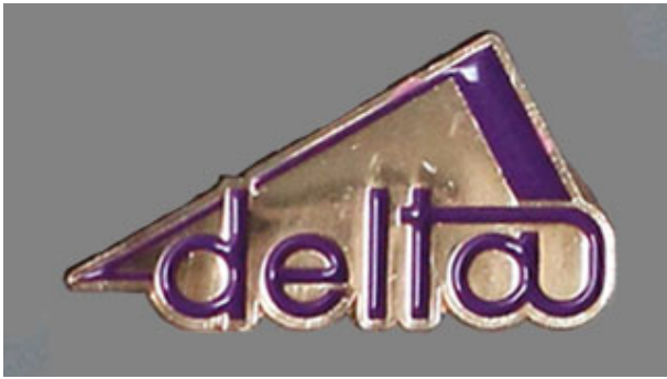
Kultainen pinssi edestä