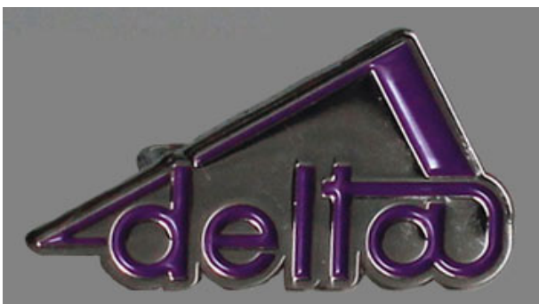
Hopeinen pinssi edestä