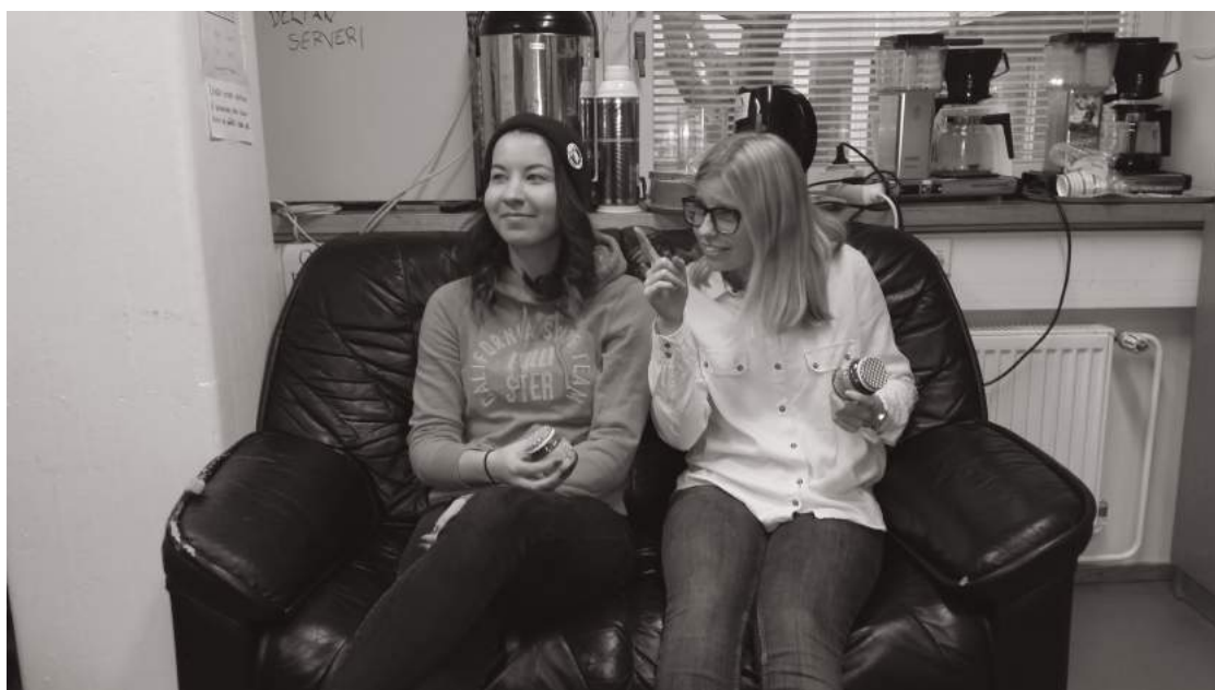
Piltit valmiina testaukseen.

Syksyn ja pilttien saavuttua alkaa yliopistolla taas perinteinen muistiinpanojen kirjoittaminen. Vanhimmat jäärät tietävät jo, että heidän ei kannata enää yrittää, mutta toisen ja kolmannen vuoden opiskelijoilla kuluu muistiinpanoja korjatessa kumi, jos toinenkin. Useimmat merkitsevät pieniin vihkoihinsa asteikon yhdestä viiteen, mutta jotkut ovat hieman kriittisempiä ja vaativat tarkempaa seulontaa asteikolla neljästä kymmeneen. Aikaisempia syksyjä muistellessa huomaa, että tulokseksi on testien jälkeen jäänyt yleensä negatiivinen, mutta kokonaisuudessaan syksyn kokemukset ovat silti aina olleet positiivisia. Kokemattomuus ei onneksi tällä alalla ole ongelma, sillä kertaus on opintojen äiti. Tämäkin syksy saatiin loistavasti päätökseen ja viimein, kun kaikki piltit on arvioitu, voidaan julkaista satunnaiset 36 koettelemusta, niin uudetkin opiskelijat tietävät, mitä ensi vuonna taas tehdään.