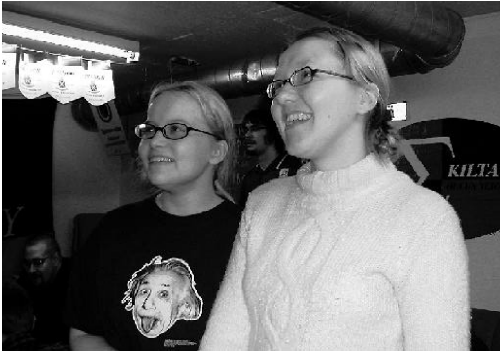
Sigmalaiset bunkkerissa pannarikesteillä.

esittelyä. Alla oleva runo lausuttiin mikrofonin bussin edessä. Tupakkataukojen kinuaminen saavutti huippunsa Jyväskylän jälkeen. Myös Deltan legendaarinen kotiviini teki kauppansa matkan aikana.