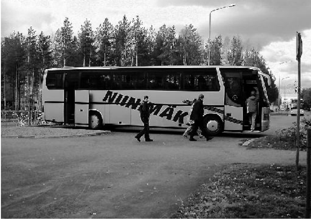
Nyt jo Oulun yliopiston pihalla.