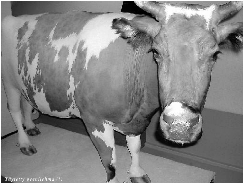
Täytetty geenilehmä (!)

Turun jättäminen kauas taakse herätti joissakin suu- ria tunteita. Itse nautin suuresti kulkemisesta Suo- men Ateenan eli Jyväskylän läpi. Kaikki eivät kui- tenkaan arvostaneet pitämäni lyhyttä Jyväskylä-