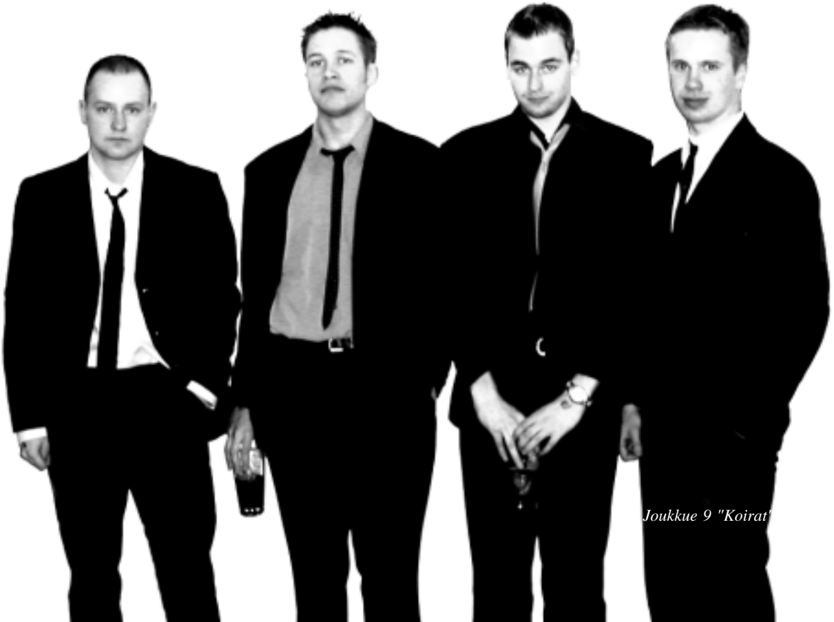
Joukkue 9 "Koirat"